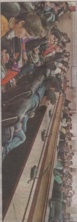
बिलासपुर कॉलेज में एक भारत श्रेष्ठ भारत कार्यक्रम के दौरान मौजूद छात्र और अध्यापक।